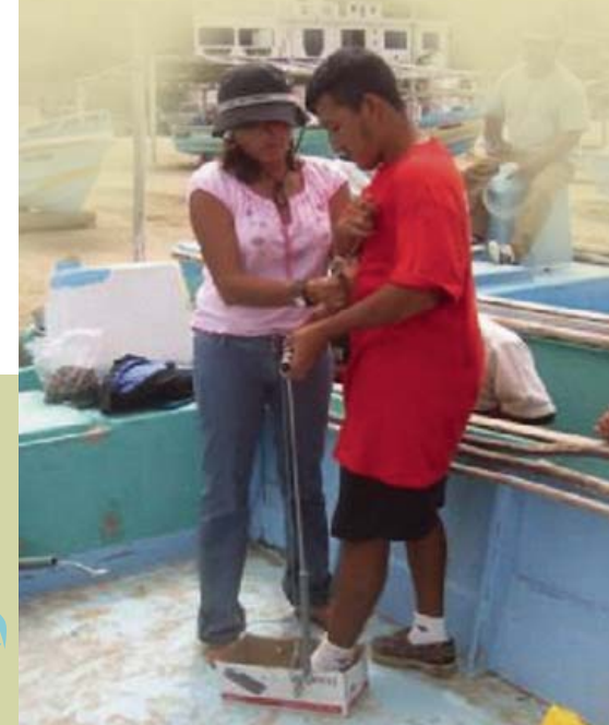
Pescador aprendiendo a usar un aparato para desenganchar tortugas.

Los problemas de la captura incidental de las pesquerías no se resolverán a menos que todos asuman su responsabilidad. El riesgo de no actuar es mucho mayor que el riesgo de actuar.