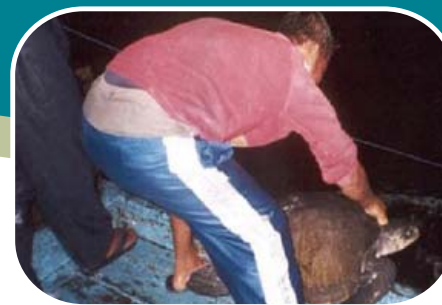
Pescadores liberando una tortuga marina.