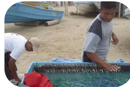
15,000 anzuelos J fueron intercambiados por anzuelos circulares durante el primer año.