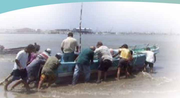
Típicas "fibras" ecuatorianas, pequeños navíos artesanales (7.2 metros de longitud).