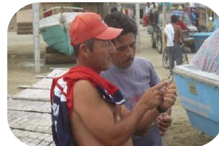
Un pescador adquiere valiosa información acerca de la efectividad de los anzuelos circulares.